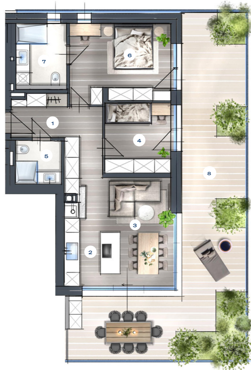
2. OBERGESCHOSS SECOND FLOOR