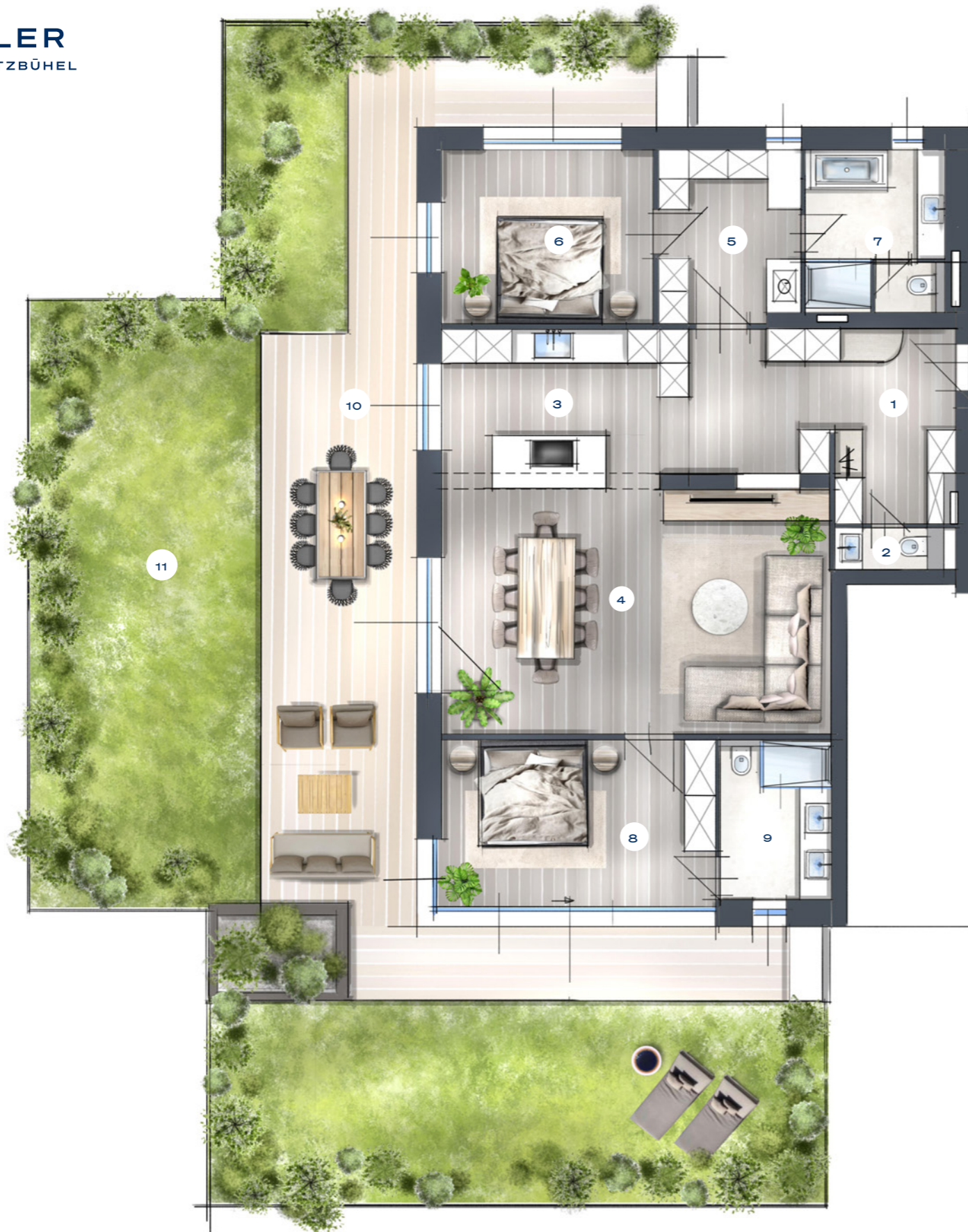
ERDGESCHOSS GROUND FLOOR