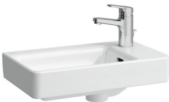
Laufen Handwaschbecken Pro S 48x28cm; HL rechts; weiß