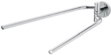
Smaragd Livio Handtuchhalter 2-arm verchromt