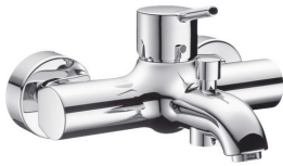
HG Talis S Einhebel-Badewannenmischer