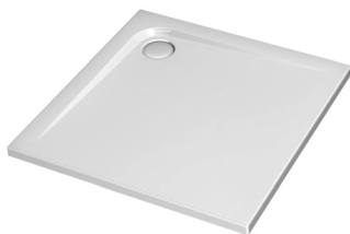
Duschtasse (Wohnung A-01: Gully)