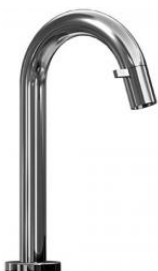
Standventil Hansanova Styleatempa Style verchromt