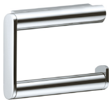
Keuco Papierhalter Plan verchromt