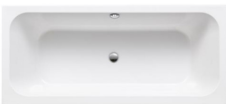
Mittelablaufwanne Acryl 180 x 80 cm weiß