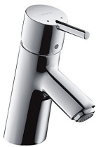
HG Einhand-Waschtischbatterie Talis S verchromt