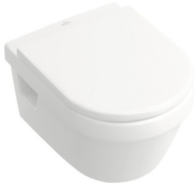
V & B Omnia Architectura spülrandlos