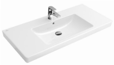
V & B Waschtisch Subway 2.0 - 80cm