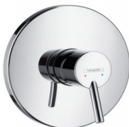
HG Talis S Einhebel-Brausemischer Unterputz