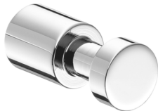
Handtuchhaken Style verchromt