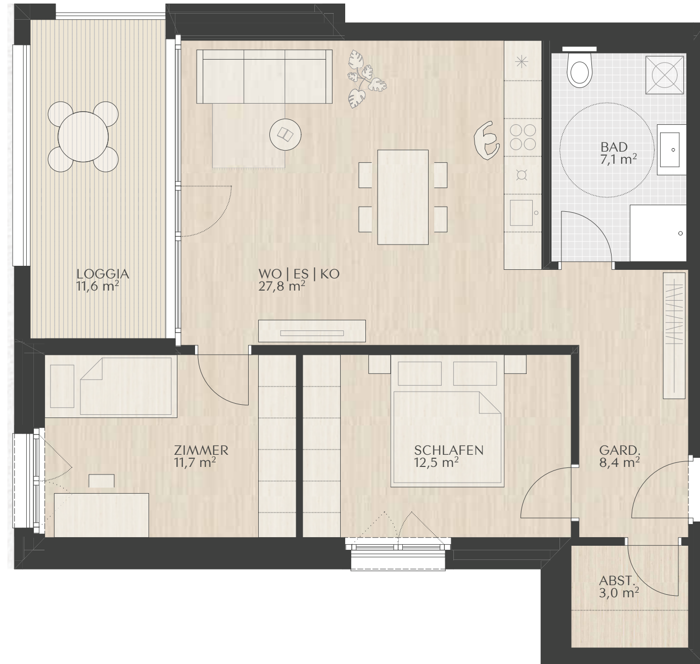
TOP 2.3 | C2