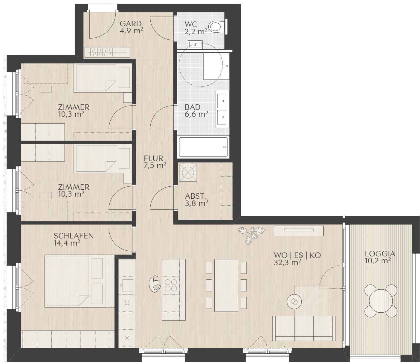
TOP2.2 | C2