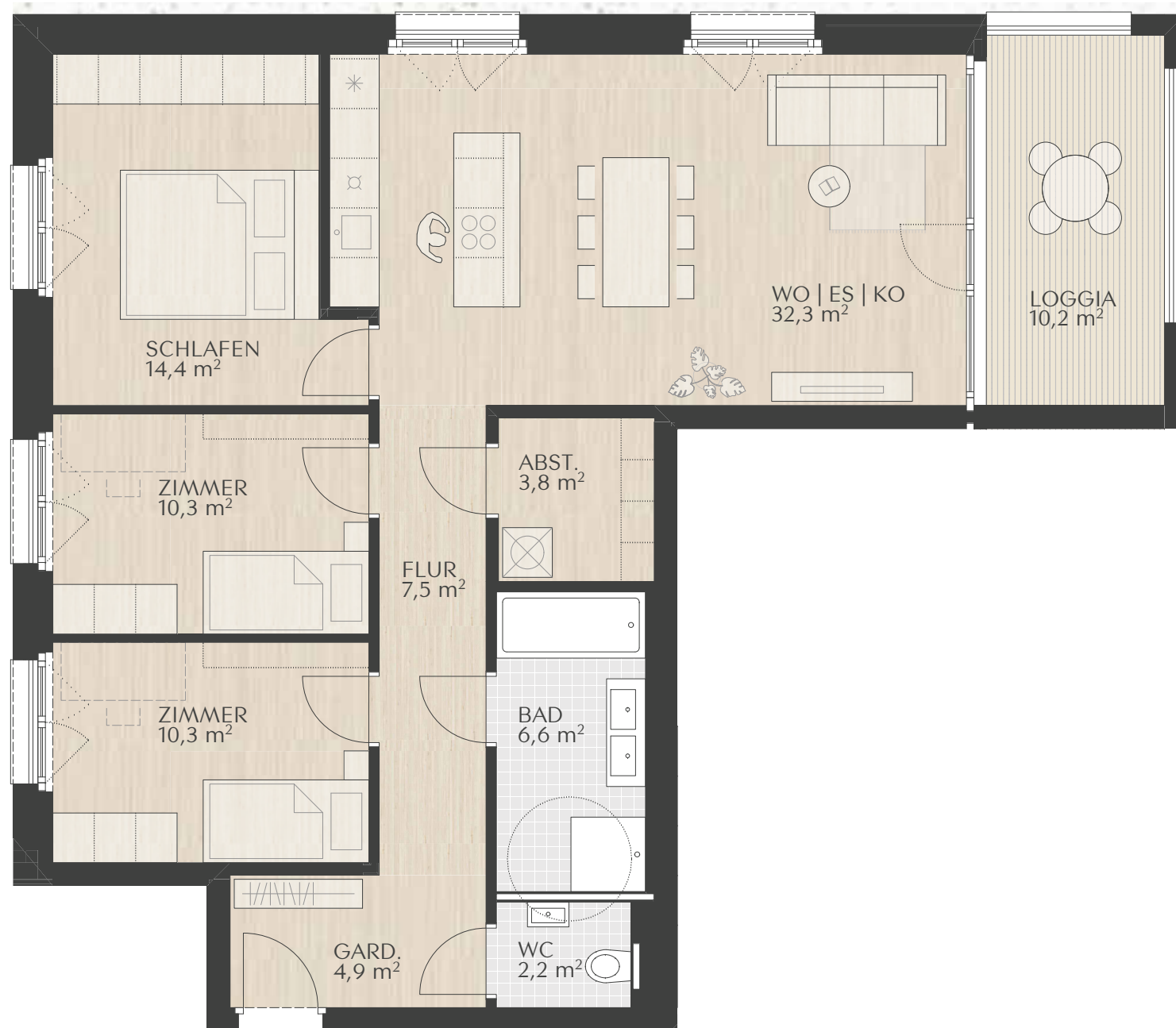
TOP 3.5 | C1