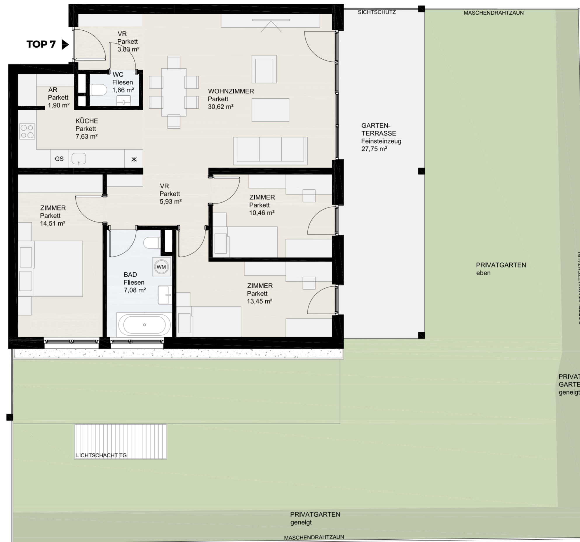
Gailweg 40 – 9500 Villach