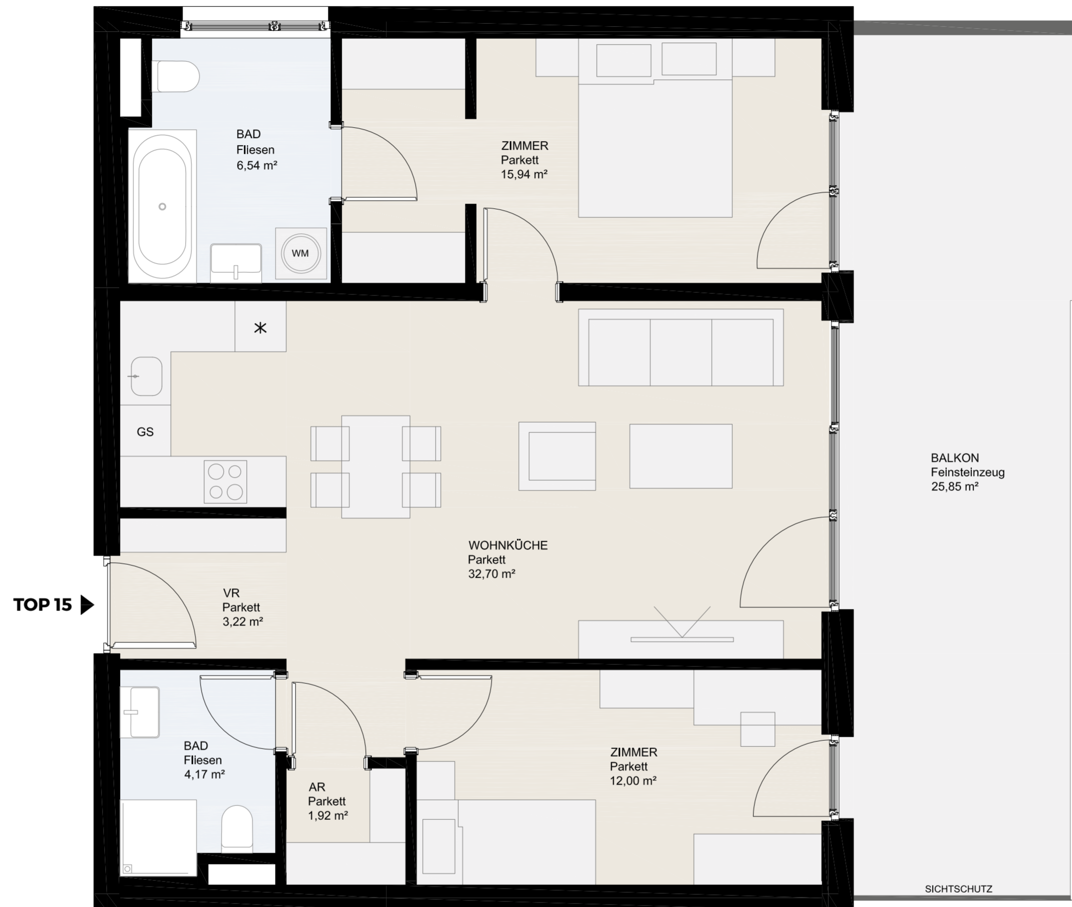
Gailweg 40 – 9500 Villach